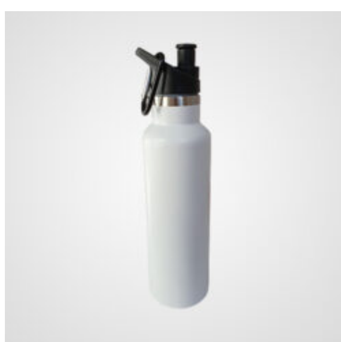
TECH METAL BOTTLES