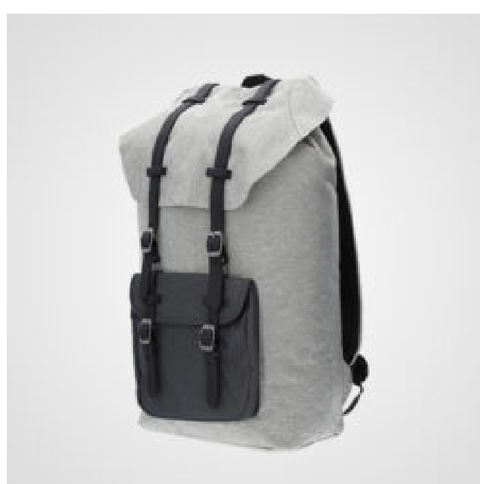
MOCHILAS Y ACCESORIOS