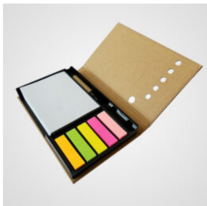
OFFICE AND WORK