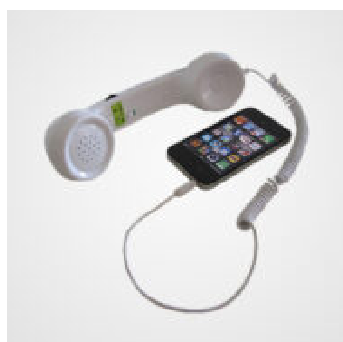
TECH FUNNY GIFTS